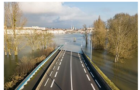
Les crues de la petite Grosne