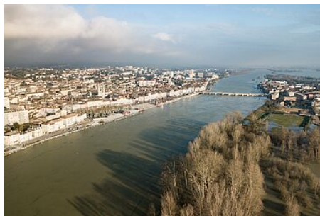
Les crues de la Saône