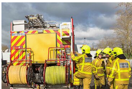
Les risques industriels