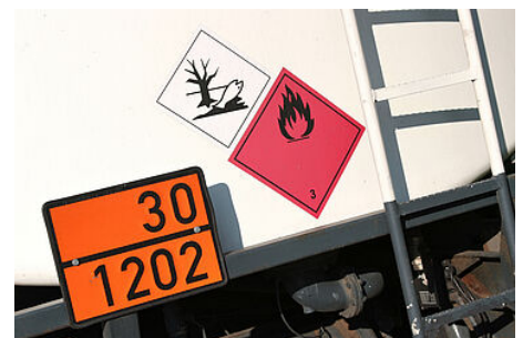
Les risques des transports de matières dangereuses