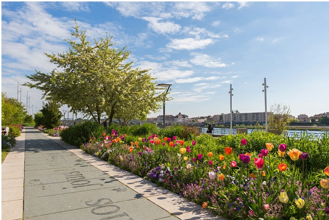
Le fleurissement à Mâcon

Depuis 1983, Mâcon est élue ville fleurie "4 fleurs" du concours national des villes et Villages fleuris, En 2010, puis en 2016, la Ville reçoit la plus haute distinction nationale "la fleur d'or".