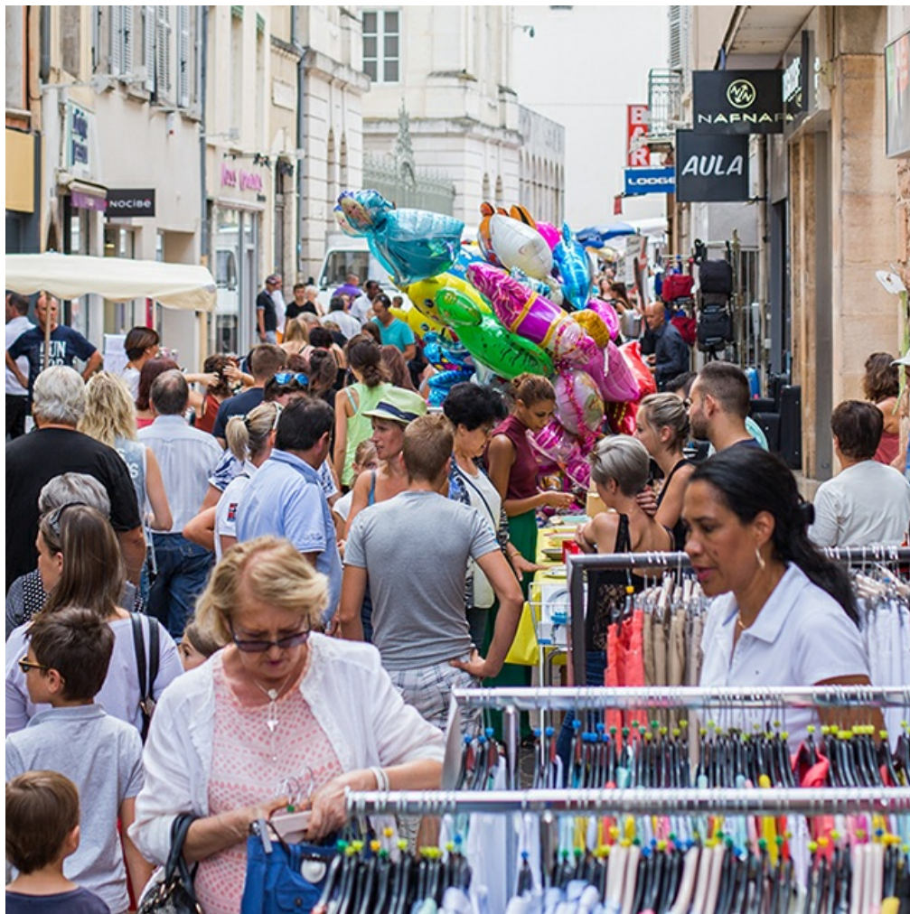
Le grand déballage en centre-ville